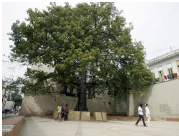
En barrios como San Isidro, en La Habana Vieja, se trabaja en el saneamiento, recuperación y mejora del alcantarillado previo.

No obstante, la modernización del alcantarillado central capitalino se mantiene como uno de los principales obstáculos a vencer. “Se está trabajando en el saneamiento, recuperación y mejora del alcantarillado previo” de barrios aledaños como San Isidro, dijo el biólogo de formación.