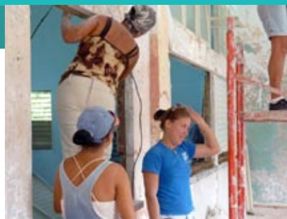
Entre las acciones constructivas fundamentales estuvo la impermeabilización de cubiertas y la restauración de la carpintería.

de constructores para, al final, conseguir evidentes mejoras en el proceso docente y beneficios directos a un total de 27.508 estudiantes y trabajadores, 53 por ciento de los cuales son niñas y mujeres.