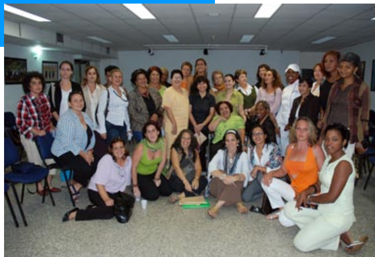
“No están todas las que son, pero las que están son”, fue el sentir del primer encuentro de las protagonistas de En primera persona .

La iniciativa es fruto de los esfuerzos del Servicio de Noticias de la Mujer de Latinoamérica y el Caribe (SEMLac), la Agencia Española de Cooperación Inter-