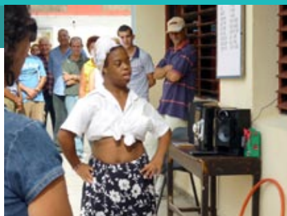
También hubo centros para niñas y niños con necesidades especiales dentro de las 112 instalaciones docentes incluidas en el proyecto financiado por AECID.