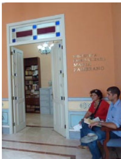
Fortalecer los vínculos históricos, sociales y culturales entre Andalucía y Cuba constituye el principal objetivo del Centro Andaluz de La Habana.